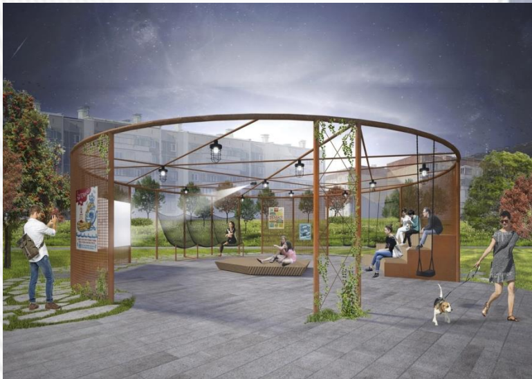
Молодежная зона отдыха

Летние кинопоказы, мероприятия, лектории под открытым небом будут проходить по разработанному плану и транслироваться на открытой сцене, где зрителем сможет стать любой желающий.