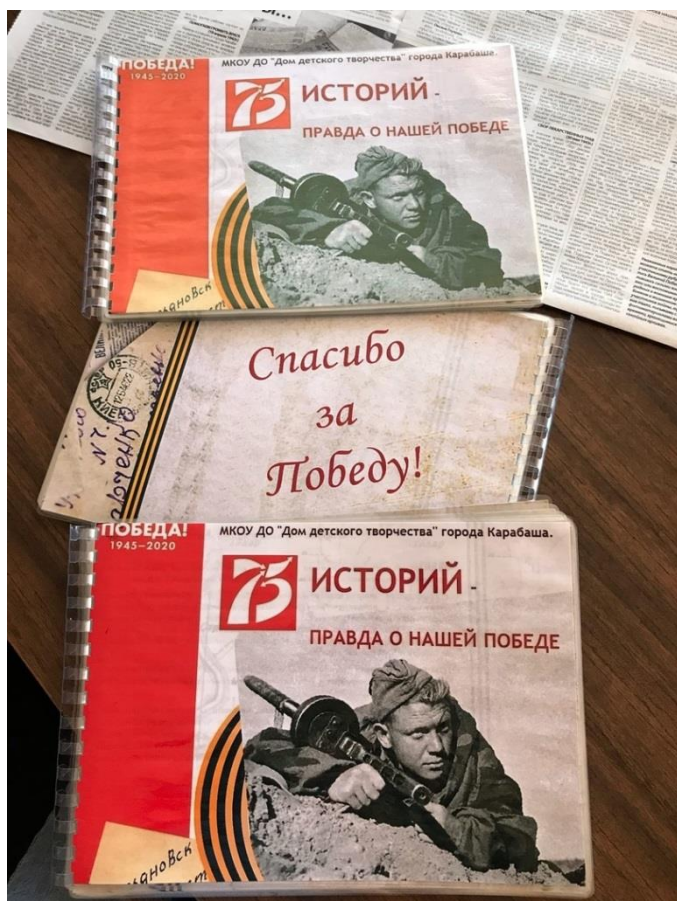
Сборник- результат работы