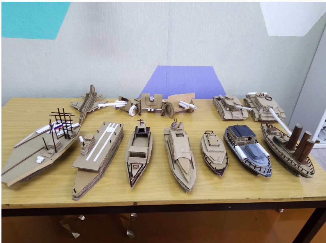
Модели военной техники времен ВОВ (работы детей)